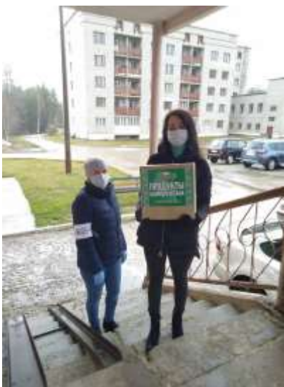
Акция в рамках проекта «Наша забота»