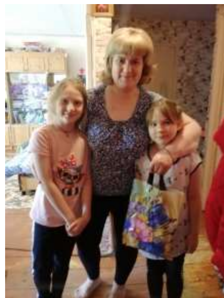
Акция ко Дню защиты детей.