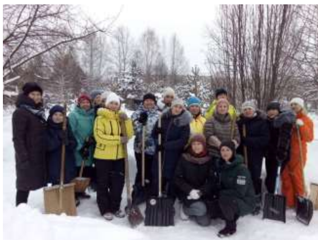
Работа по благоустройству территории Центра: акция «День чистоты».