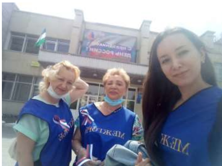
Акция, посвященная Дню России.

Сотрудники Центра активно участвуют в волонтерской деятельности.